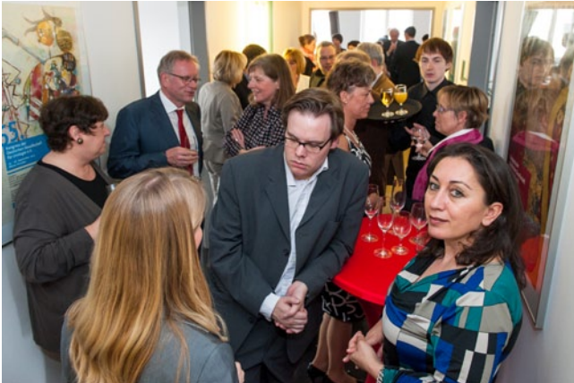
Bei der offiziellen Einweihungsfeier in den Räumen des Hauptstadtbüros, nutzten Gäste und Gastgeber die Gelegenheit zum Austausch.

Am 17. April 2013 wurde es offiziell eingeweiht: das neue gemeinsame Hauptstadtbüro von DGU und BDU in Berlin Charlottenburg. Die Vorstandsvertreter beider Verbände konnten hochrangige Gäste aus dem Gesundheitswesen und Repräsentanten der Hauptstadtpresse sowie der urologischen Fachpresse